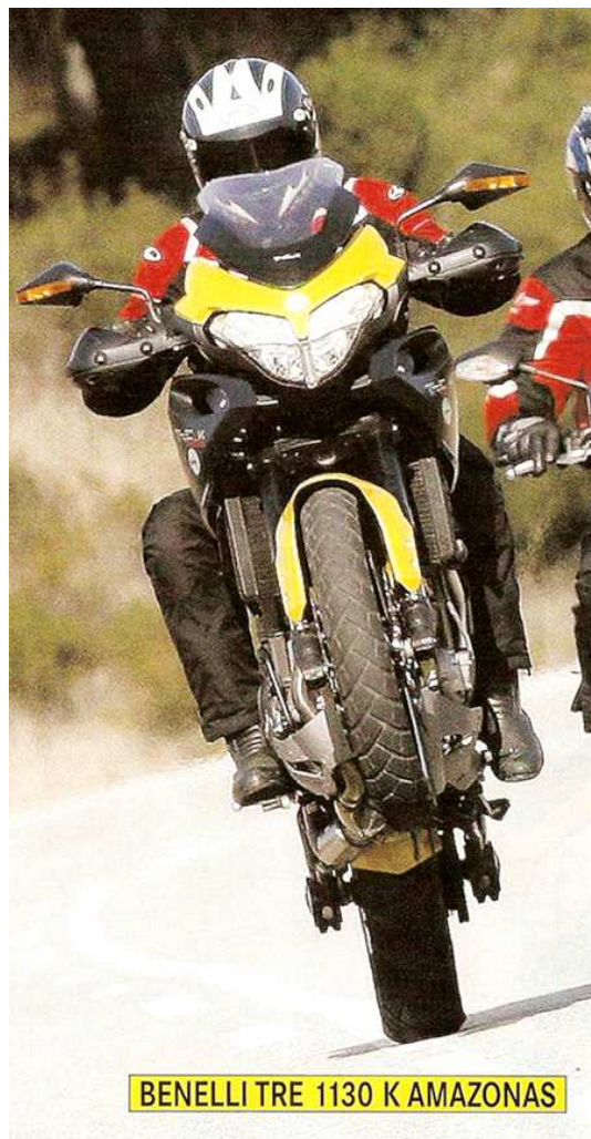
BENELLI TRE 1130 K AMAZONAS